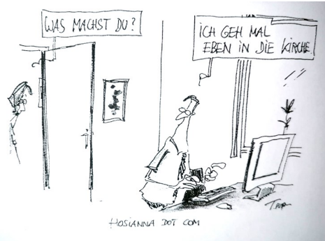
Plaßmann, Thomas, in: Die Lösungen für junge Leute 2020, Eintrag vom 31.03.

Auf Dekanatsstufe wird es ab 2022 einen Beauftragten für Öffentlichkeitsarbeit (0,5 Stellen) geben, der Informationen zu Terminen und Sachinhalten in Presse, Radio u.a. Medien koordinieren und optimieren wird. Dies ist bereits eine Maßnahme in Vorbereitung auf die Umsetzungen der Landesstellenplanung (LaStPl) der ELKB. Die langwierigen Vorarbeiten zur LaStPl sind jetzt abstimmungsbereit. Viele langwierige Vorarbeiten, Diskussionen um Notwendigkeiten, Wünsche, Priorisierungen und eine möglichst gerechte Arbeitsgrundlage für die Jahre ab 2023/24 stehen zur Abstimmung im Dekanatsausschuss im März an. Das vorliegende Dokument wird in der nächsten KV-Sitzung abgestimmt, das